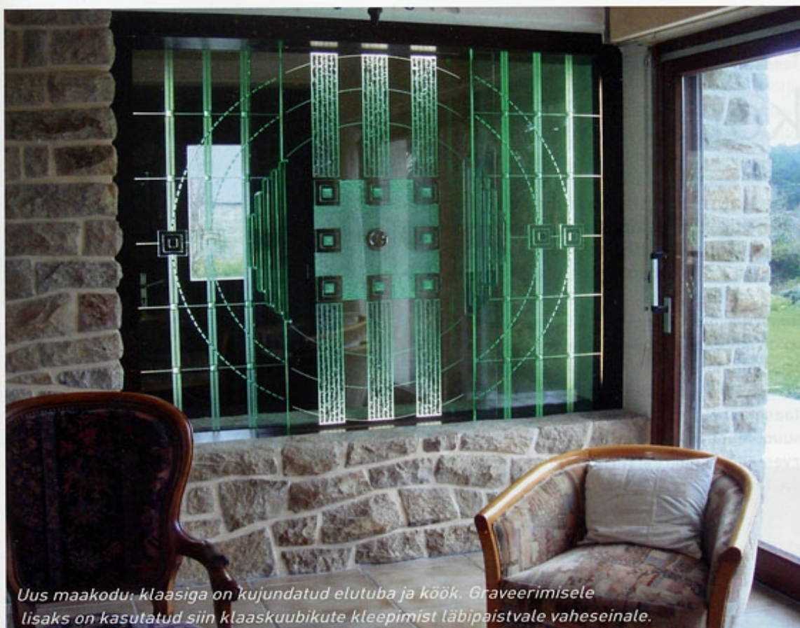
Uus maakodu, klaasiga on kujundatud elutuba ja köök. Graveerimisele lisaks on kasutatud siin klaaskuubikute kleepimist läbipaistvale vaheseinale.