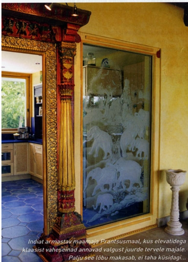
Indiat armastav maamaja Prantsusmaal, kus elevatidega klaasist vaheseinad annavad valgust juurde tervele majale. Palju see lõbu makasab, ei taha küsidagi...

“Kuna töö on kehale väga kurnav, siis olen ma õppinud lihtsalt väga kiiresti töötama. Nii