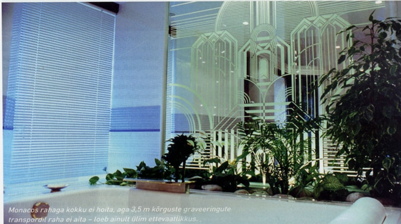
Monacos rahaga kokku ei hoita, aga 3,5 m kõrguste graveeringute transpordil raha ei aita – loeb ainult ülim ettevaatlikkus.

Tulemus on õrn ja habras, aga töö ise tulemusele vastupidiselt füüsiliselt koormav ja keha-